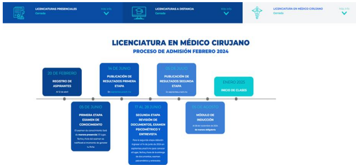
Ilustración 1 Sitio oficial para el desarrollo del proceso de admisión